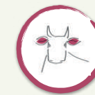
Aiuola 7. VETERINARIA