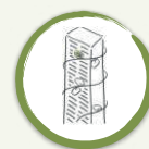
Aiuola 1. EDILIZIA e MANUFATTI