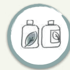
Aiuola 3. COSMETICA e DOMESTICA