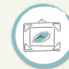
Aiuola 8. BELLEZZA

L'Orto botanico ospita circa 100 specie vegetali autoctone , simbolo della cultura popolare, suddivise in 8 aiuole tematiche : 1. edilizia e manufatti, 2. Medicina tradizionale, 3. cosmesi e uso domestico, 4. cucina alimentare malenca, 5. riti e scaramanzia, 6. giochi antichi, 7. cura degli animali, 8. bellezza del mondo vegetale. Ogni specie è accompagnata da una cartellinatura dedicata.