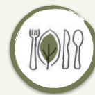
Aiuola 4. ALIMENTARE