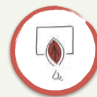
Aiuola 2. MEDICINA