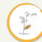
Aiuola 5. RITUALE-SCARAMANTICA